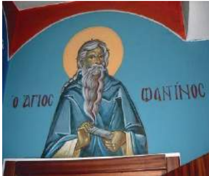
Saint Phantinos passe une grande majorité de sa vie à Melicucca aux côtés de saint Élie le Spéléote.