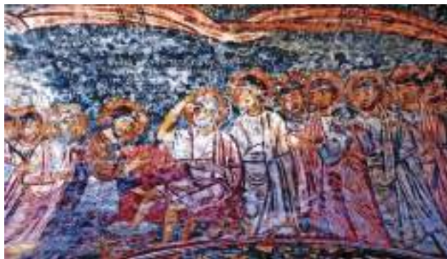
Fresque de l'église de Saint-Pierre à Otranto

Le plus ancien monastère apulien qui ait été mis à jour est celui de Saint-Pierre de Tarente d'où le plus ancien document grec s'élève à l'an 975: le catépan d'Italie, Michel, confirme des privilèges au monastère et il décide de laisser libre de toute servitude certaines possessions. Concernant l'Apulie latine, dont la ville offrait une grande diffusion du monachisme byzantin, Bari devint le centre de colonie grecque 71 .