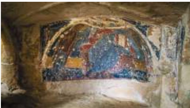
L'église de Saint-Ange à Mottola