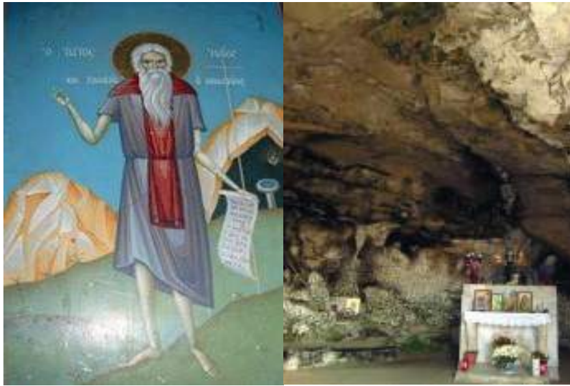
Saint Élie le Spéléote et la grotte Saint-Élie le Spéléote (X e siècle)

Si le moine est un livre vivant comme le décrit Saint Cyrille Philéote 75 , c'est par les bioi des saints italo-grecs qui prouvent la particularité de leur monachisme toujours tout près des deux mondes.