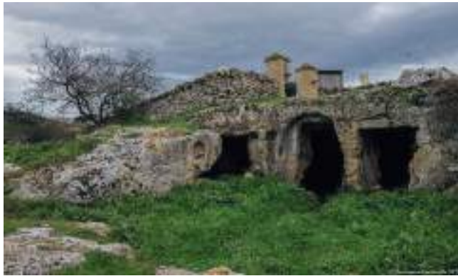
L'église de Saint-Ange à Mottola