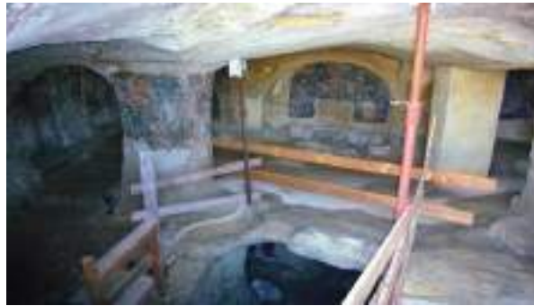
Les deux niveaux de l'église de Saint-Ange

Le monastère de Saint-Nicolas de Pergolète un peu plus loin de Galatone, nous rappelle son origine basilienne vu que ce monastère a été construit pendant l'époque de Basile I. On rencontre des parchemins datés de l'an 879 avec le rapport sur un prêtre Dionysios. Jusqu'au X e siècle, l'endroit était un culte de la liturgie byzantine ainsi qu'un lieu d'enseignement pour les moines. Par la suite, ce monastère a été transmis aux Bénédictins par l'intermédiaire des Normands 70 .