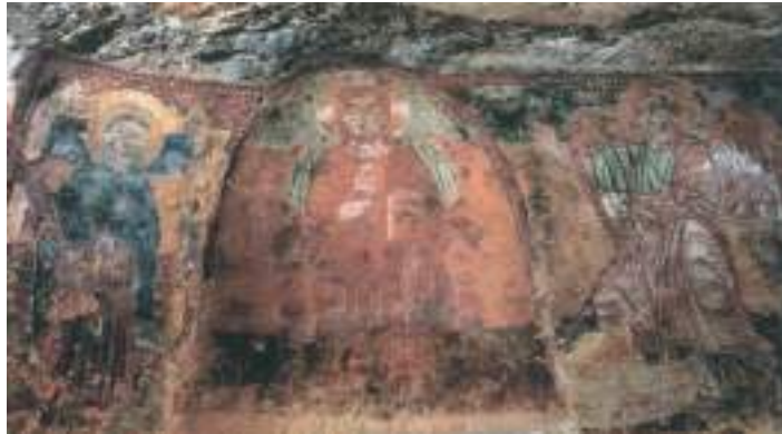
Jésus-Christ au trône et l'Évangélisation par Théophylacte (959). + Μνήσθη[η]τη, Κ[ύρι]ε, τοῦ δούλου σου Λέων- τος πρεσβι[τέ]ρου κ[αί] τη(ς) συ[λ]βίου αὐτοῦ Χρυσό- λεας κ[αί] Παύλ[ου] του υιοῦ αὐτοῦ. Ἀ[ΔΥ]ν. Γραφεν δια χνιρ[ος] Θεοφυλά- κ]του ζογράφου ιχηνί Μα]ήο ἰνδικτίον[ος] β ε]τους ς- υ ξ ζ. L'an du monde 6467 correspond à l'année 959.

qui s'opposa au mouvement iconoclaste. La fresque de ce saint prouve encore une fois, la grande diffusion du canon discipline de saint Studite dans l'Italie méridionale.