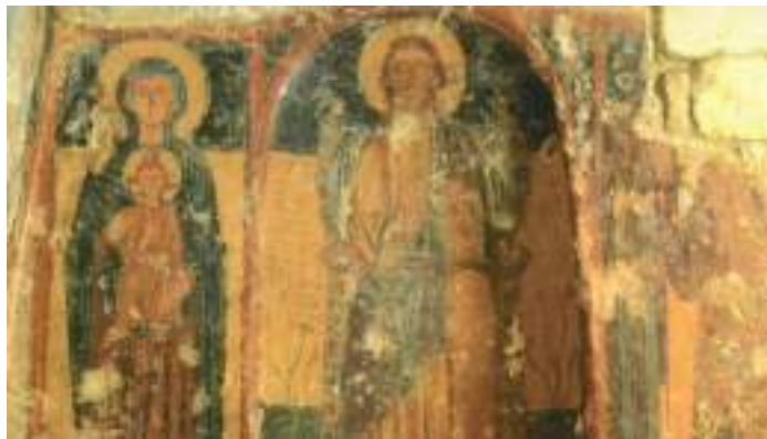
Fresque d'Eustathe où Jésus-Christ bénit de la façon grecque et tout à côté, la Vierge avec Jésus Christ (1020). + Μν[ή]σθη[η]τι, Κ[ύρι]ε, του δούλου σου Ἀδριανού και της σηνβίου αὐτου κ[αί] τον τ[έ]κνων αὐτοῦ του που λω ἀνηκοδομή σ]αντος και ἀνηστο ρ]ήσαντ[ος] της πανσ[έ]πτας ὑπονάω ταύτας. Μηνί [μαρ[τίω] (ἰνδικτίονος γ ετ[ους] ς- φ κ η. Γραφεν δηα χνιρ[ος] Εὐσταθίου ζογράφου. Ἀμ[ή]ν. L'an du monde 6528 correspond à l'année 1020.