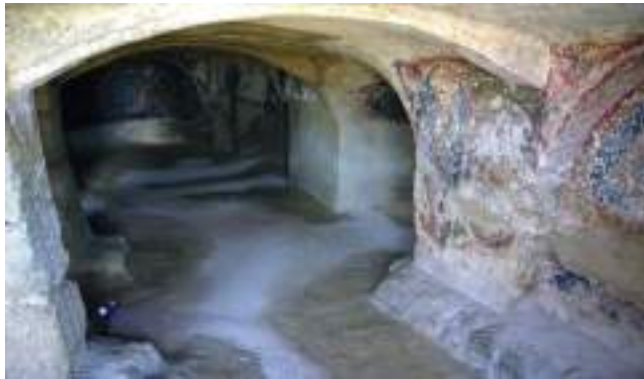
Les fresques de l'église souterraine de Saint-Ange