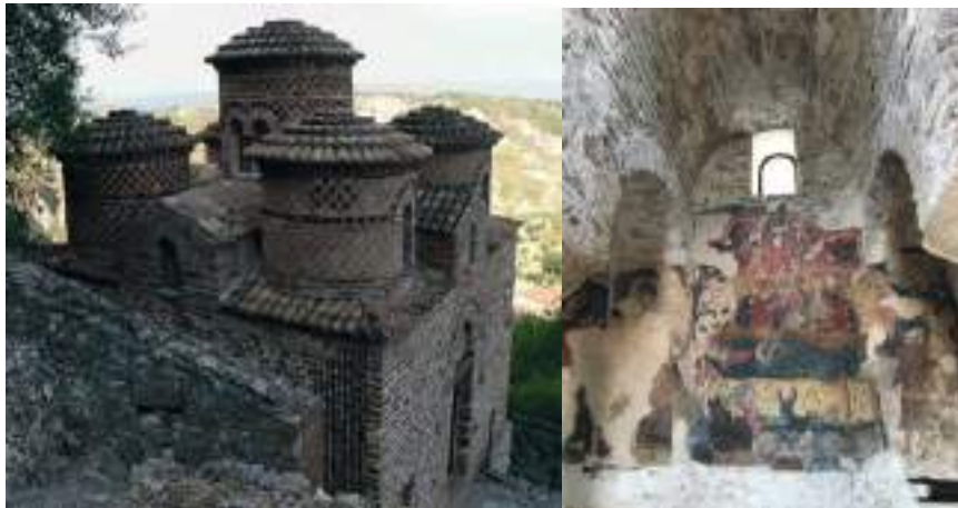
Cattolica di Stilo (Reggio) et l'intérieur de Cattolica di Stilo.

Dans la ville de Gérace (en grec Ierakas, la sainte Kyriaki des Byzantins) qui se situe presque au sud-est de Calabre dans la ville-Kastello, on rencontre l'église de Jean-Chrysostome datée du IX e siècle qui représente le signe de la multiculturalité de l'époque. L'église se trouve entre deux autres églises: celle de Saint-François d'Assise et celle du Cœur de Jésus-Christ. L'église de Cattolica, de Santa Severina, de Rossano ou de l'église de Patir sont des monuments incontestables de l'époque byzantine: Léon le Philosophe ou le Mathématicien dans Diatyposis (886-911): [...erat et Sancta Severina Metropolis...] une métropole qui, de sa position (un surnom bien connu comme le bateau de la pierre) constituait la ville-kastello des Byzantins. On n'est pas certain de l'existence d'une sainte avec un tel prénom, mais ce qui est certain, c'est que Nicéphore Phocas l'avait aussi surnommée comme Nicopolis, ville qu'on rencontre aussi dans l'Épire. Mais en Calabre, la ville la plus fameuse des grottes érémitiques des moines était à Meliccouca où se trouve la crypte de Saint-Élie le Spéléote, vers le X e siècle 73 .