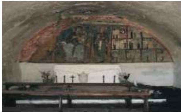
Crypte de Sainte-Lucie à Melfi