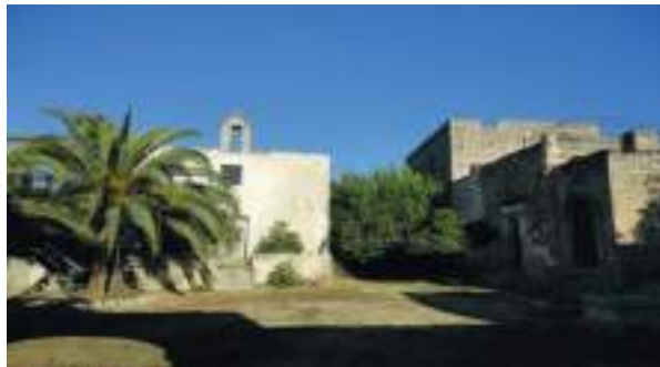
Le monastère de Saint-Nicolas de Pergolète

Le monastère de Saint-Nicolas de Pergolète un peu plus loin de Galatone, nous rappelle son origine basilienne vu que ce monastère a été construit pendant l'époque de Basile I. On rencontre des parchemins datés de l'an 879 avec le rapport sur un prêtre Dionysios. Jusqu'au X e siècle, l'endroit était un culte de la liturgie byzantine ainsi qu'un lieu d'enseignement pour les moines. Par la suite, ce monastère a été transmis aux Bénédictins par l'intermédiaire des Normands 70 .